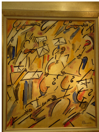
St Paul de Vence Villanueva Antonio « Philharmonique »