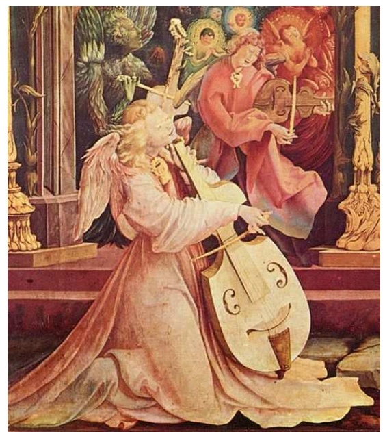
Détail du retable d'Issenheim : le concert des anges

Jusqu'à la fin du XVIIIème siècle, la viole de gambe était l'instrument roi, joué par tous les nobles dont un certain nombre d'instrumentistes ont été reconnus dans toute l'Europe. (Pensez au film d'Alain Corneau « Tous les matins du monde » qui retrace la vie de Marin Marais et de son maître M. de Sainte Colombe).