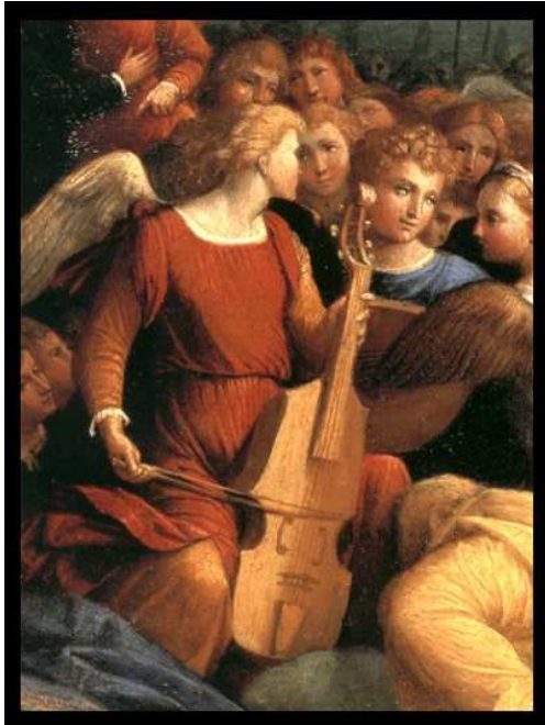
Benvenuto Tisi Vision St. Augustine jouant de la viole de gambe