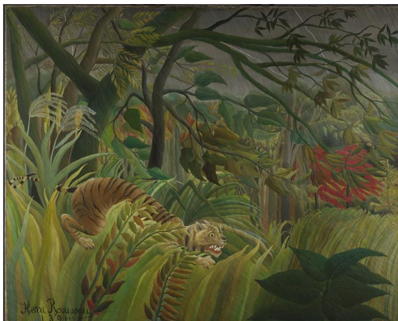
Surpris ! , huile sur toile, 1891, Henri Rousseau dit Le Douanier Rousseau

https://www.photo.rmnp.fr/CS.aspx?VP3=SearchResult&VBID=2CMFCIXK33PPF&SMLS=1&RW=1366&RH=626